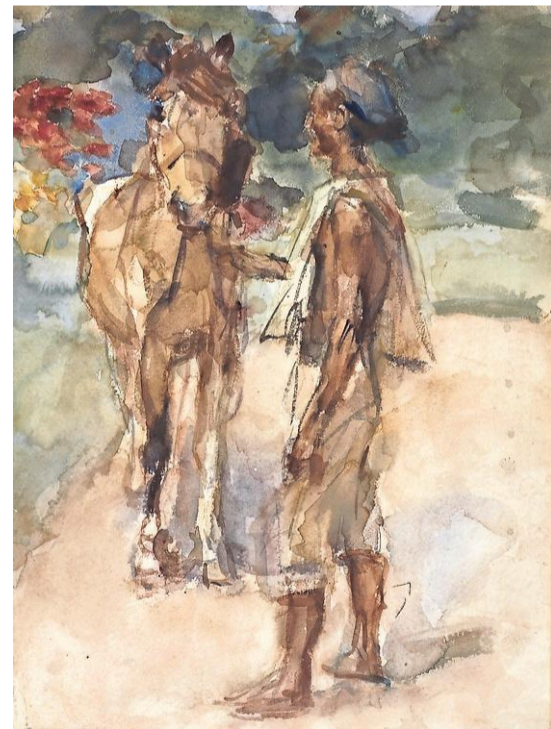
Javaan met paard, aquarel van Isaac Israëls uit 1922.

Van alle families van slaven die in 1714 in Nederlands-Indië werden vrijgelaten, dankzij een Nederlandse koopman die zijn tijd ver vooruit was, leven nog nabestaanden. Maar velen kennen het verhaal van hun herkomst niet. Het Westfries Museum in Hoorn brengt daar verandering in.